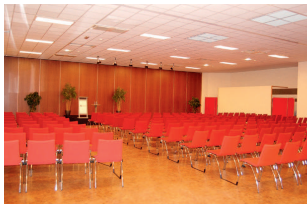
Patio Sud 4+5