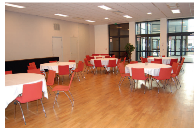
Salle Patio Sud 6